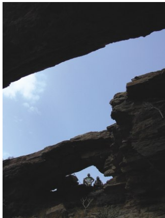
Arco del Coronadero