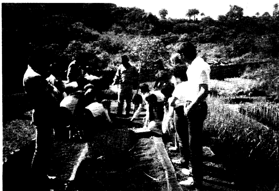
Alumnos haciendo prácticas en el vivero del Jardín Canario.

Fomentar el debate sobre objeto, fines y situación actual de la E.A. en Canarias.