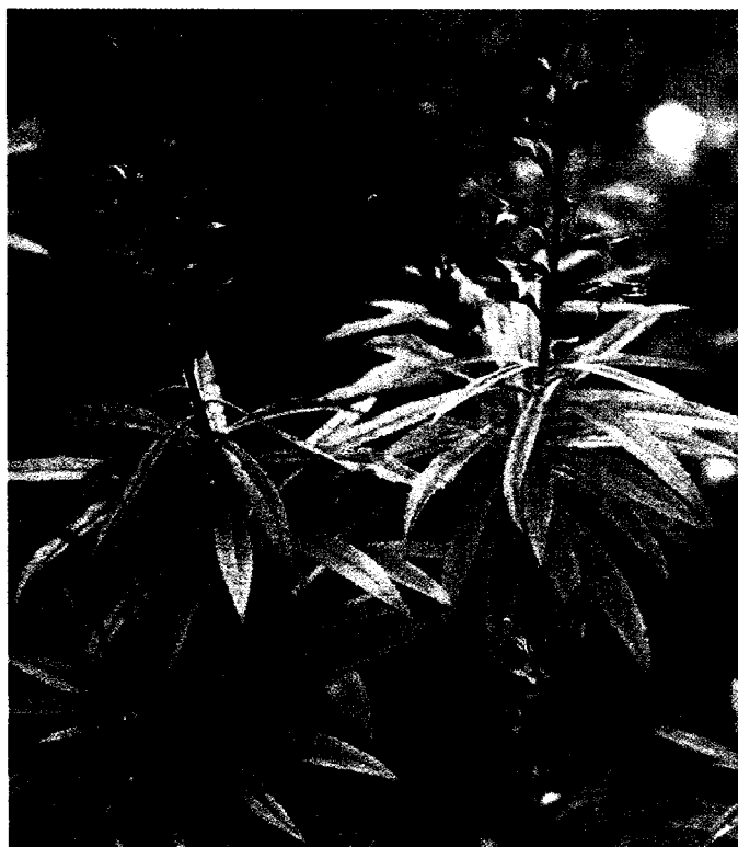
Una de las especies que conforman el Proyecto Life.