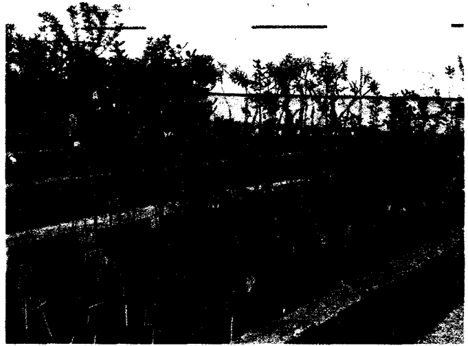
Cultivo de Dorycnium spectabile .

Aunque comunes a muchas otras especies del mon-