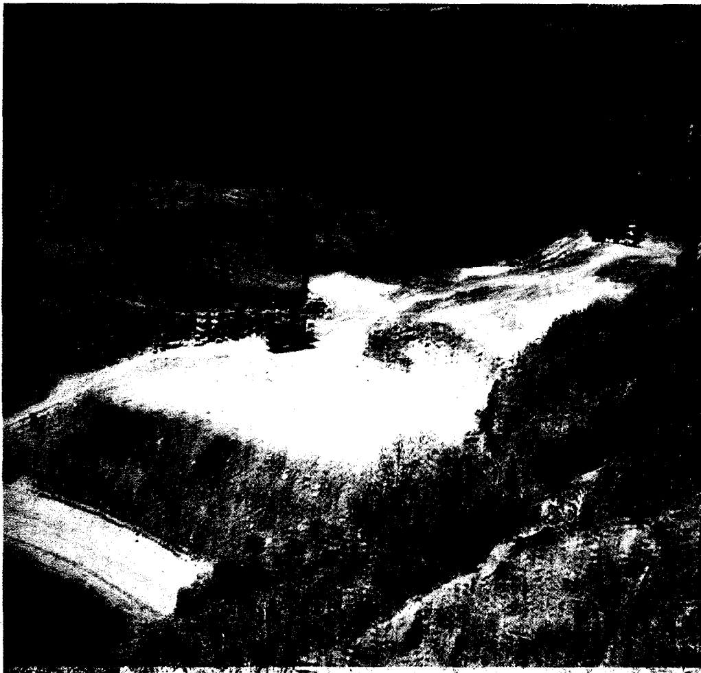
Fase II: cubrimiento de residuos. Vertedero de El Salto del Negro (Gran Canaria).