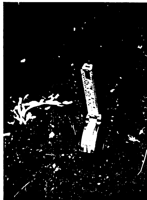
Efectos del ganado sobre una planta joven de Tanacetum oshanahanii .

creta de cada una de las especies seleccionadas, básicamente su localización, número de poblaciones y de individuos, estructura y dinámica de la población, factores de amenaza, etc.